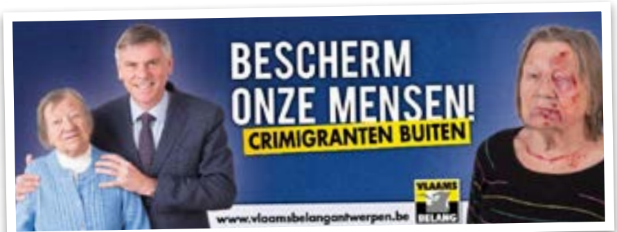
« Protégeons notre population! Les crimigrants dehors » Affiche électorale du Vlaams Belang, Avril 2018