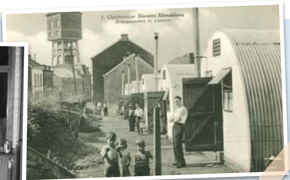
Charbonnage de Wérister. Siège des Xhawirs

Court-Saint-Etienne.