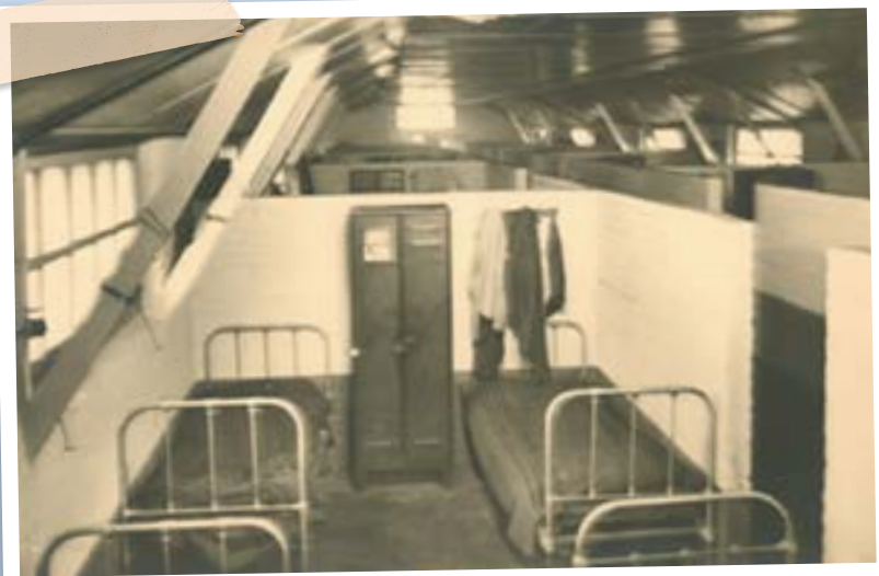
Vue intérieure d'un baraquement

Le prix demandé par le charbonnage pour un logement d'ouvrier seul, incluant la nourriture, le chauffage, l'éclairage et le blanchissage des draps de lit, s'élève à 72,5 francs belges par jour (moins de 2 euros), soit au total, plus de 2.000 FB par mois (50 euros), pour un salaire mensuel de 6.800 FB (170 euros).