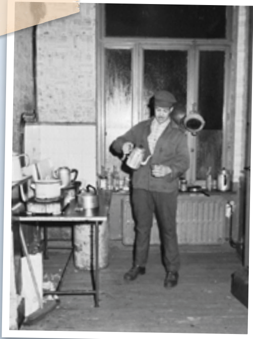
Travailleur aux usines sidérurgiques Henricot

Court-Saint-Etienne.