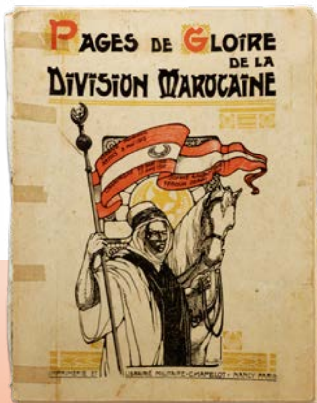
Librairie Militaire Chapelot, Paris, s.d., Collection Dahan-Hirsch, Centre de la Culture Judéo-Marocaine (CCJM), Bruxelles