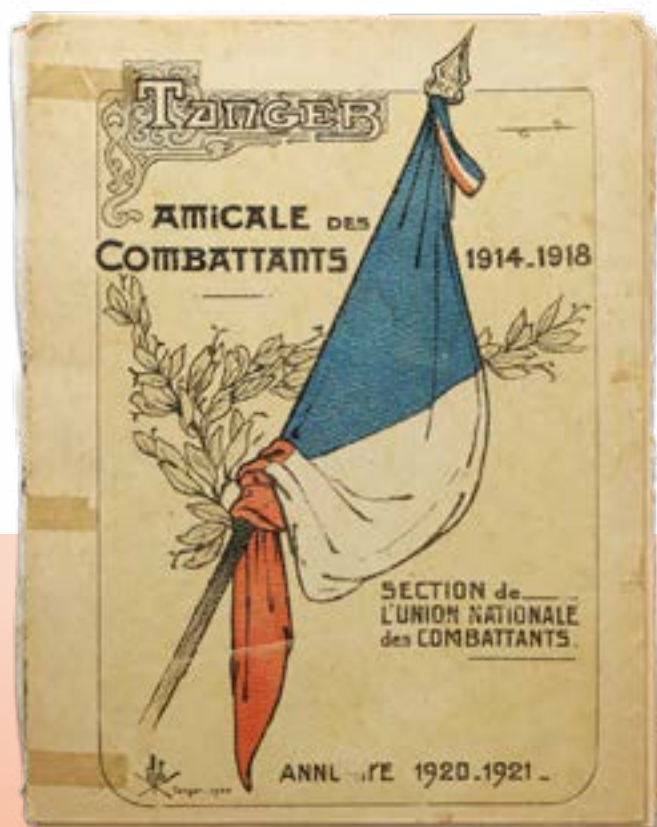
Collectif, Imprimerie moderne Henri Tellier, Tanger, 1920